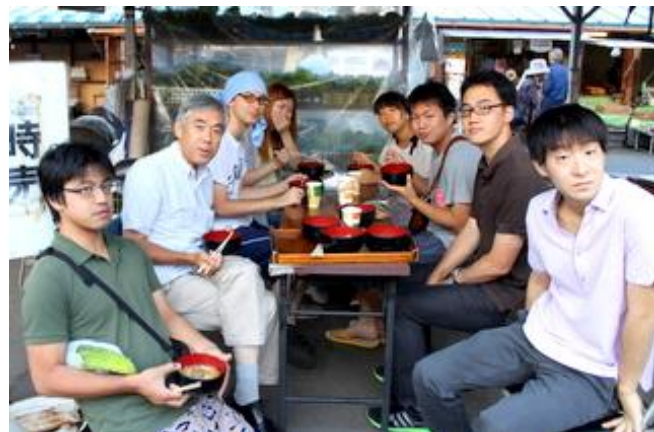
2016.9.8 盛岡市神子田朝市で学生文書伝道合宿の朝食 5:30am 礼拝・始業 7:00am